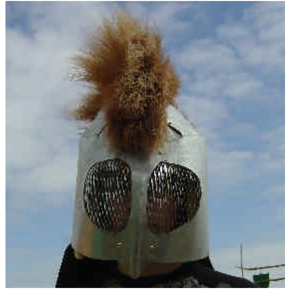
Fjallaféllus var að vonum ánægður með árangurinn og stoltur af sínum mönnum

Menn Fjallaféllusar ( rauða liðið ) unnu næturleikinn sannfærandi. Öll lið komu sínum vopnum til foringja sinna en menn Fjallaféllusar voru morðóðari og höfðu því sigur.