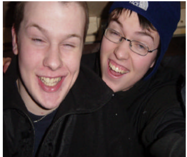
Hvað er þetta??????????