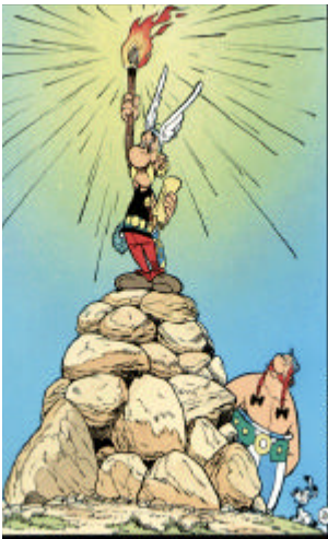
D.S. Asterix eru snillingar

Eru Móri og Skotta virkilega á svæðinu. Svar við þessu fæst í næsta blaði.