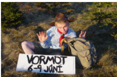
Snilld síðan í fyrra :)