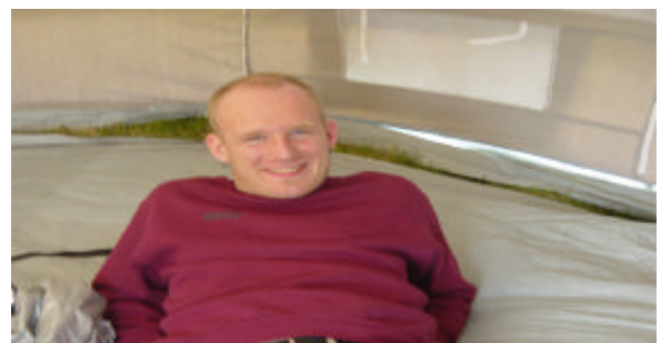
Einn gleymnasti maður mótsins í ár.